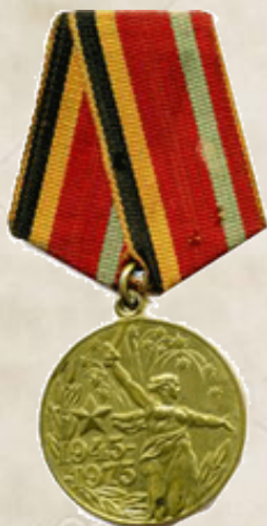
30 лет победы в Великой Отечественной войне 1941-1945 гг