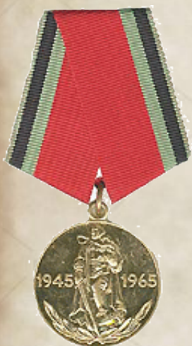
20 лет победы в Великой Отечественной войне 1941-1945 гг.