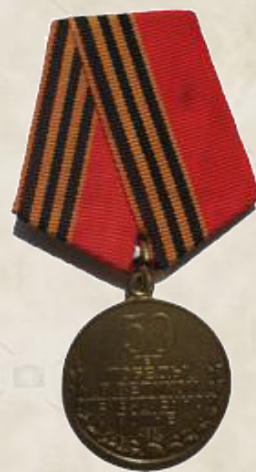
50 лет победы в Великой Отечественной войне 1941-1945 гг