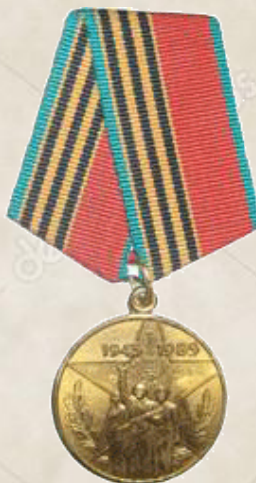
40 лет победы в Великой Отечественной войне 1941-1945 гг.